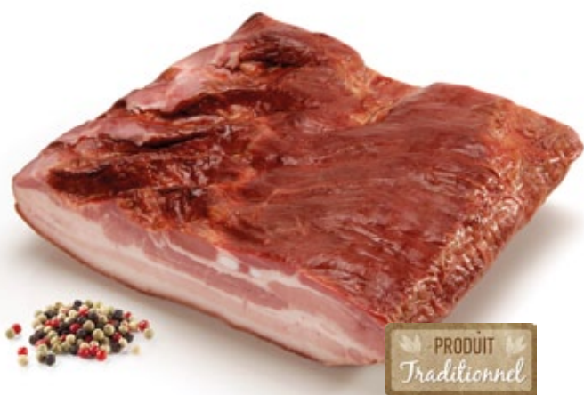
Bacon Traditionnel Extra | Traditioneller Bacon Extra