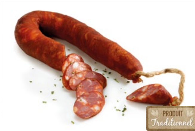
Chorizo Régional «Argola» Extra | Regionale Chorizo „Argola“ Extra