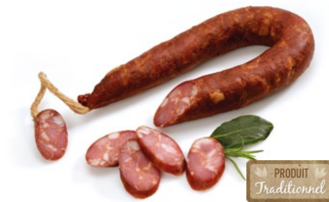
Chorizo Traditionnel «Quinta» | Traditionelle Chorizo „Quinta“