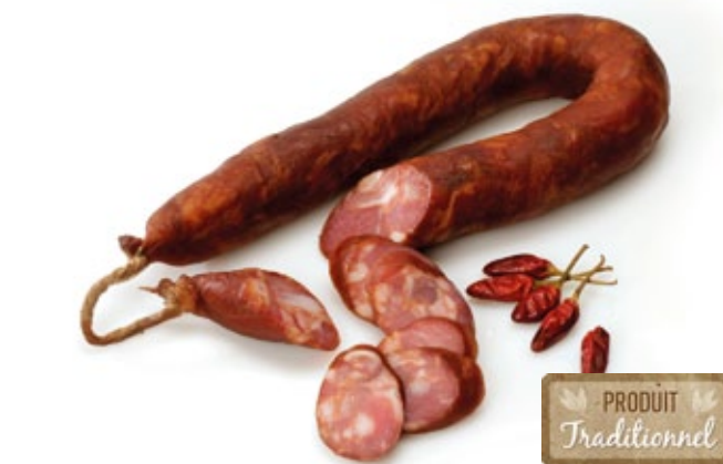
Chorizo Traditionnel «Quinta» Piquant | Traditionelle pikante Chorizo „Quinta“