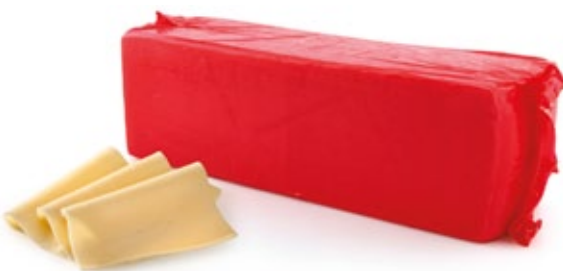
Fromage Barre Edamer | Edamer Käse