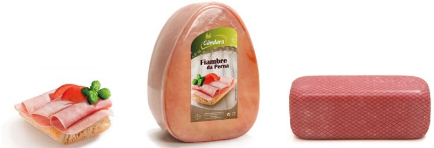
Jambon | Kochschinken vom Bein